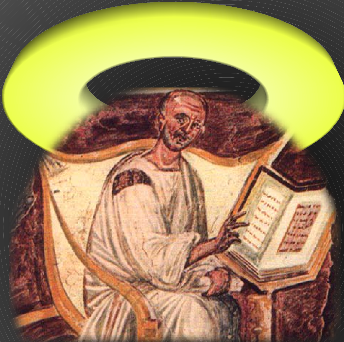
Heilige Augustinus (354-430)