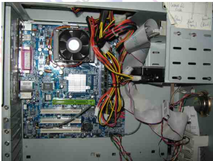
Een oude computer met weinig RAM ...?

Het eerste wat ik deed was OpenOffice Presentations starten. Na 11 minuten was dat programma eindelijk gestart, maar toen had ik ook al geconstateerd dat Ubuntu vanaf CD draaien op deze computer niks voor mij was.