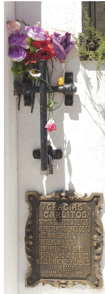
8. Expressie met details

Met Picasa (van Google, gratis) of Irfanview (gratis) zijn ook aanpassingen mogelijk. De correctiemogelijkheden zijn wel beperkter dan die van eerstgenoemde programma's.