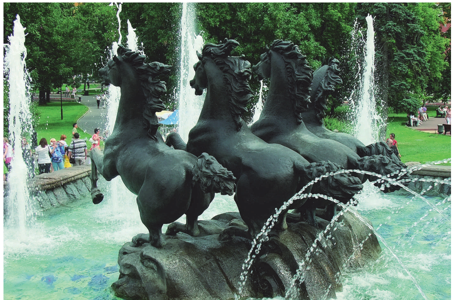
9 Toon de maat