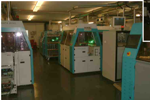
Enkele disc-persen

Het maken van een glassmaster is een tijdrovend karwei. Eerst worden de bitjes op een fotogevoelige glazen plaatje gezet. Na etsen en wat andere bewerkingen is het eindresultaat metalen stempels, die gebruikt worden door de perserij. Twee per