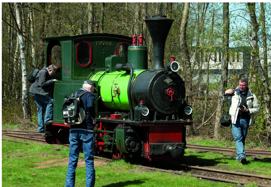
Rugzak (links) en schoudertas (rechts)

De fotorugzak mag uiteraard niet onvermeld blijven. En bij de ontwikkeling hiervan hebben (wederom) de buitensportproducenten een belangrijke bijdrage geleverd. Eigenlijk staat de betere bergsportrugzak model, inclusief de betere verstelbare gepolsterde schouder-, heup en borstriemen, maar waarbij de inhoud volledig is afgestemd op fotomateriaal. Ook de rugzakken zijn, afhankelijk van de grootte van de uitrusting, in vele maten verkrijgbaar. De relatie met de bergsport hoeft uiteraard helemaal niet te betekenen dat ze alleen voor buitensporters geschikt zouden zijn. Integendeel zelfs, ze worden vrij breed ingezet. Bijvoorbeeld ook bij urban photography. En ook de prof die naar een locatie moet en onderweg liever de handen vrij heeft, is een gewaardeerd gebruiker. Er is een - zeker niet onbelangrijke - subvariant, nl. de rugzak die deels is ontworpen voor foto-uitrusting en deels ruimte biedt voor persoonlijke zaken zoals eten, drinken