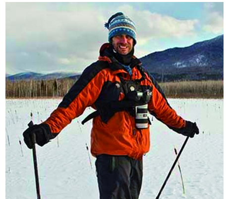
Cameravest in de vorm van een harnas

voorgevormde zakken. Zodanig dat camera's en lenzen er in kunnen worden opgeborgen. Ik zie ze wel eens bij reporters, maar ik ben nog geen amateur met zo'n vest tegengekomen (maar die zullen er ongetwijfeld zijn). Het kan handig zijn, en dan vooral als je heel vrij moet kunnen bewegen (liever geen tassen om of aan je lijf) en de handen vrij moeten blijven. Er is ook een variant: een soort 'harnas' van ergonomisch gevormde banden, die een opengewerkte bodywarmer vormen, en waaraan je losse vakken kunt bevestigen. Dan wordt het als het ware een maatpak. Die harnassen zijn vaak geënt op de riemen van een rugzak, en kunnen dus een prettig draagcomfort bieden.