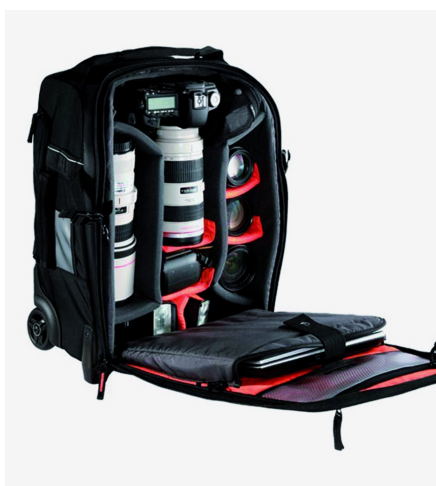
Trolley (het loopt op rolletjes)

De trolley zit grofweg in het verlengde van de fotokoffer. Vaak iets kleiner, en zodanig ontworpen dat ze, waar nodig, ook nog relatief makkelijk met de hand zijn op te pakken. In tegenstelling tot de koffer zie je bij de trolley wat vaker dat ze (deels) van zachtere materialen zijn gemaakt. Bijvoorbeeld cordura. De doelgroep is ongeveer hetzelfde als bij de fotokoffer. Ook bij de grotere trolleys, die bij vluchten niet als handbagage kunnen worden meegenomen, wordt aandacht besteed aan duurzaamheid onder meer voor het kunnen stuwen in laadruimtes.