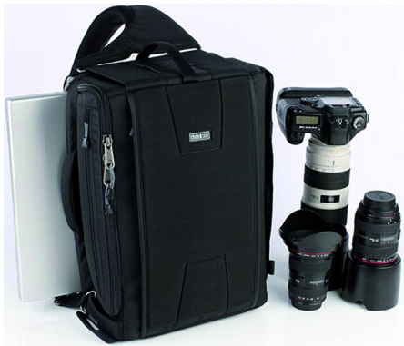
Slingbag. Eén schouderband (on)handig?

Een redelijk nieuwe variant (alhoewel, toch al weer een aantal jaren op de markt) op de rugzak is de slingbag. Ik vind het een bijzondere verschijning; de een vindt het functioneel en de ander vindt het niets. Maar de ontwikkeling is uniek. De slingbag hangt op één brede en comfortabele riem over een schouder (er zijn modellen voor linkse en rechtse dragers), maar zit verder mooi recht gepositioneerd op de rug. Het zit als het ware tussen een schouder tas en rugzak in. Het bijzondere is dat je hem in één beweging voor je