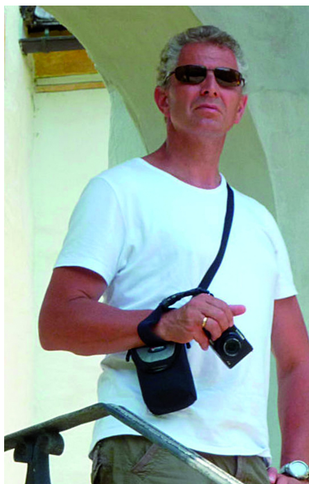
Paraattas voor compactcamera