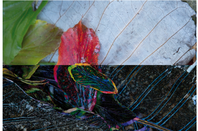
Afbeelding 8: Eén foto, twee lagen, bovenste laag iets verschoven. Boven de oorspronkelijke foto van bladeren, onder het resultaat van de overvloeimodus.

De kleuren die ontstaan in het combinatiebeeld worden door het programma berekend. De overvloeimodi 'verschil' en 'aftrekken' staan onderaan (rode pijl in afbeelding 7 naar onderen volgen) en geven de meest spectaculaire resultaten. 'Verdelen' geeft het effect van een pentekening. Ook hier geldt dat het resultaat niet altijd te voorspellen is, het blijft uitproberen. Ook bij gebruik van de 'overvloeimodus' zijn aanpassingen van een van de lagen mogelijk, zoals veranderen van transparantie, het weggommen van delen van een van de foto's en zo meer. Na samenvoegen van de lagen is verdere bewerking mogelijk.