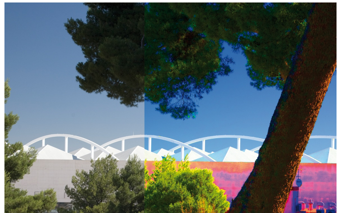
Afbeelding 4: Links oorspronkelijke beeld, rechts maximaal verzadigd.

kleurtonen een aanpassing. Vibrance en verzadiging zijn beide zelfs te gebruiken in tegenovergestelde richting. Een foto kan sprekender worden als de kleurverzadiging is verhoogd, maar pas op, te veel verzadiging geeft een effect alsof het om een grafische afbeelding gaat (zoals in afbeelding 4 rechts).