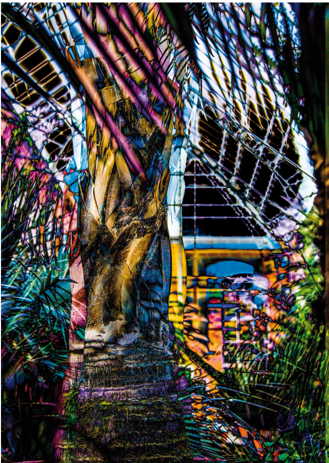
Afbeelding 1: Palmboom in de Hortus te Amsterdam.

Het gebruik van kleur is niet voorbehouden aan schilders, modeontwerpers en architecten. Ook de fotograaf kan door gebruik van kleur zijn foto's een extra dynamiek geven. In dit artikel bespreken we hoe de fotograaf de kleuren in zijn foto's kan versterken of zelf creatieve kleurrijke beelden kan maken, zoals bijvoorbeeld de foto op de voorkant van de SoftwareBus 2014-1.