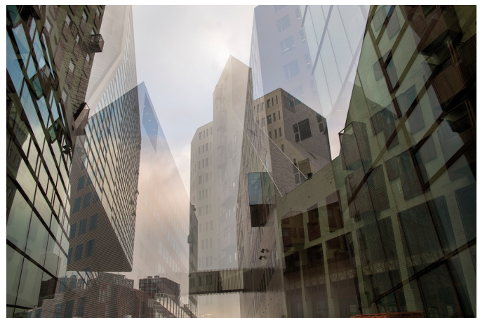
Afbeelding 5: Paleis van Justitie te Amsterdam, dubbelopname met twee foto's.

Het begon bij mij uit nieuwsgierigheid naar hoe je een dubbelopname maakt op de computer en of dat anders is dan de dubbelopname met een fototoestel. Ook intrigerend is het gebruik van de overvloedmodus als je met lagen werkt (afbeelding 7). Dat gaf aanleiding tot 'het maar eens uitproberen'. Het resultaat van dit experimenteren is helaas niet te voorspellen, vaak is het alleen geschikt voor de prullenbak. Maar soms, soms, ontstaan fantastische beelden. Sommige fototoestellen hebben een functie waarmee twee of meer opnamen over elkaar kunt maken. Net alsof je vergeten bent je filmrolletje door te draaien. Soms is er ook nog een keuze mogelijk in de intensiteit van de opnames. Kleuren worden over elkaar gezet en beelden in de ene opname worden doorbroken door lijnen van de andere opname. Omdat de dubbele opname nogal contrastarm kan zijn, is het nodig in de uiteindelijke foto het contrast te verhogen. Afbeelding 5 is daarvan een voorbeeld.