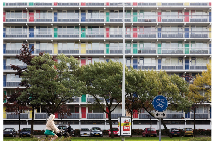
Afbeelding 2: Kleur om je heen

Zoals voor zoveel geldt ook hier 'oefening baart kunst'. Steeds meer automatisch zal dan de foto niet alleen door het beeld, maar ook door de kleur erin worden bepaald.