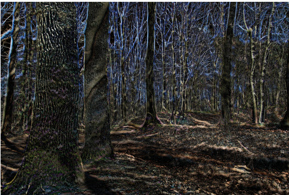
Afbeelding 9: Het bos is erg spannend geworden.

Is het nog fotografie? Of is het de fotografie voorbij?