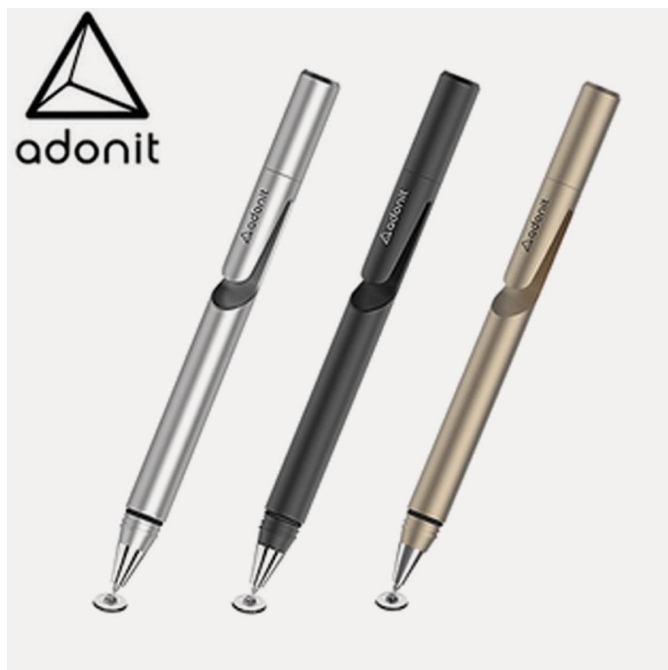
Afbeelding 2: De Adonit Jot mini 2.0 is een goedkope aanrader voor elke iPad

je er zelfs twee voor ongeveer datzelfde bedrag bij amazon.de . Twee bestellen is handig omdat je dan de verzendkosten uitspaart. Deze pennen werken erg vloeiend, maar zijn niet drukgevoelig. Een nadeel is dat je ze wel iets hoort en om kleine krasjes te voorkomen is het dan ook beter om als screenprotector een dunne folie op je scherm aan te brengen. De Adonit Jot Pro maakt door een extra stootkussentje iets minder geluid en is iets minder 'krasgevoelig'. Ook is de Jot Pro iets langer, waardoor je de pen wat beter kunt vasthouden (zie afbeelding 2).