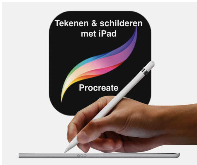
Afbeelding 1: Procreate is de populairste app voor tekenen en schilderen op de iPad

Voor de iPad zijn er tientallen goede, gratis en goedkope apps waarmee je de meest schitterende digitale tekeningen of schilderijen kunt maken. Iedereen met een iPad 2 kan zonder veel geld uit te geven al aan de slag, want je hebt ook geen kosten voor papier of verf. Ook erg prettig is dat je nooit hoeft te wachten tot de verf droog is en als iets je niet bevalt, kun je gewoon snel de laatste wijzigingen terugdraaien.