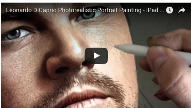
Afbeelding 4: Bekijk op apple.hcc.nl hoe realistisch je een portret kunt tekenen met Procreate

Je kunt tekeningen in meerdere lagen maken in een hoge (4K) resolutie. Bij een tekening van 8000 bij 8000 pixels kun je bijvoorbeeld in vier lagen werken. Een groot pluspunt van Procreate is ook dat de app snel reageert. Vanuit Procreate kun je je werkstukken exporteren als png- of jpg-afbeelding, maar ook als Photoshop-bestand met behoud van alle lagen. Heel grappig is ook dat er van je tekening ook automatisch een filmpje gemaakt wordt. Door die functie kun je heel veel filmpjes vinden van digitale tekeningen en schilderingen die met Procreate gemaakt zijn. Bekijk op apple.hcc.nl maar eens hoe gedetailleerd het portret van Leonardo di Caprio wordt getekend met een Apple Pencil (zie afbeelding 4).