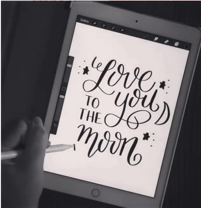
Afbeelding 3: Met Procreate kun je gemakkelijk mooie letters tekenen

Je kunt zelf extra brushes maken en ook brushes van anderen downloaden. Procreate is ook de ideale app voor wie het leuk vindt afbeeldingen met elkaar te combineren in een collage. Verder gebruiken veel mensen Procreate om heel mooie letters te maken (kalligrafie). Met Procreate op een iPad Pro en een Apple Pencil kun je al snel heel mooie resultaten bereiken. Kijk maar eens op www.instagram.com/ipadlettering/