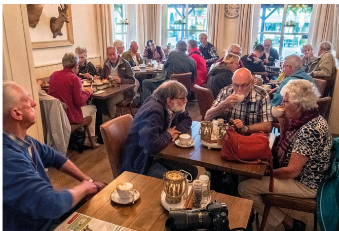
Gezellig aan de koffie met gebak

Op de voorafgaande vrijdag hebben we, kijkend naar het regenachtige weer, nog even de wenkbrauwen gefronst. Maar de zaterdag bleek een heerlijke dag te worden, met zon en wolken. Kortom het ideale fotoweer. En het buitje van vijf minuten op het midden van de dag kon de pret niet drukken. Het leuke van zo'n klein stadje is dat je met enige regelmaat het pad kruist van een medefotograaf, en even bij elkaar polst wat er zoal op de geheugenkaart is vastgelegd. Maar ook is verrassend hoe je binnen de bescheiden afmetingen van Elburg in alle stilte en door niemand gestoord kunt fotograferen. Het kan niet anders dan dat de foto-opbrengst heel groot zal zijn.