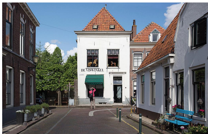
De foto graaf in volle actie

nieke plekje te vinden. Een straatimpresie, een tafereel, maar vaak ook heel subtiele details. En niet te vergeten ook de vele historische gebouwen en andere oude dingen. Een leuke bijkomstigheid is dat vele stadsbewoners er een sport van maken om de huizen, stegen en stoepen te versieren met bloemen; ook dat is door diverse fotografen uitgebuit. Wie elkaar tegenkwam sprak vaak zijn verwondering uit over hoeveel verschillende dingen je binnen zo'n klein stadje kunt fotograferen.