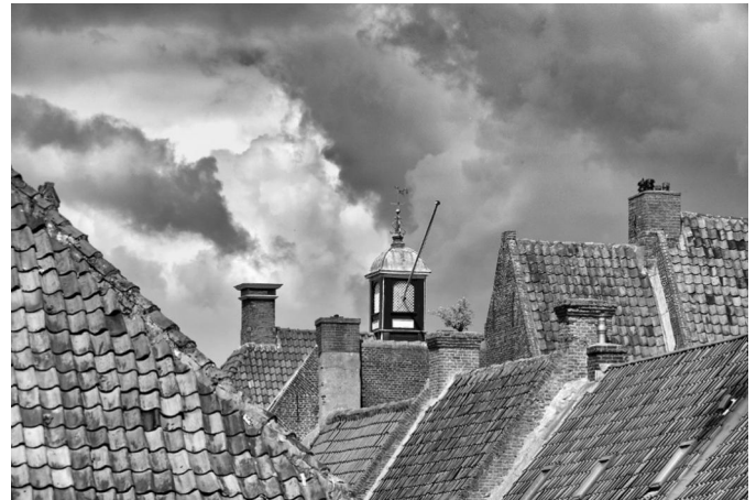
Over de daken