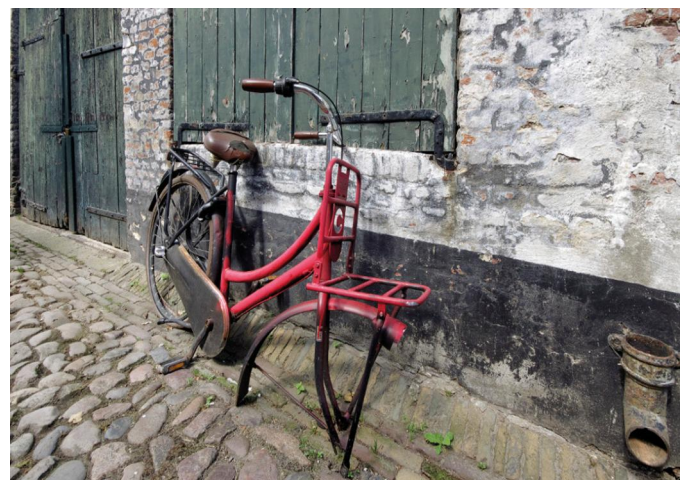
Niet zo'n mooi 'beeld', maar wel een mooi plaatje