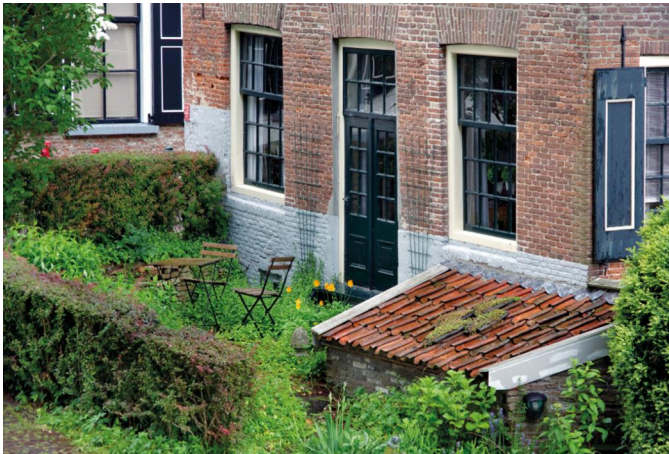
Een karakteristiek dijkhuis

Wat wordt de bestemming volgende jaar? Voorstellen zijn altijd welkom. Heb je een idee, stuur dan even een mailtje naar digifoto@compusers.nl .