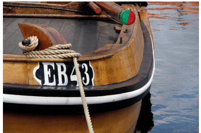
Geliefd foto-object - de bruine vloot