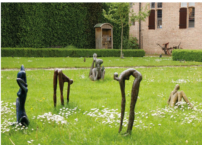
In de beeldentuin