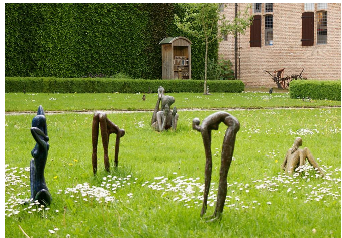
Beeldentuin Elburg

Nieuw - en in ieder geval ook in deze eenvoudige setting - is een foto-review-activiteit. Daar willen we foto's die men meeneemt, en waar men problemen mee heeft - liefst op USB-stick zodat we ze groots op beeldscherm of beamer