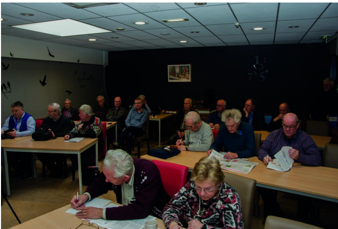
Een goed bezochte lezing

Al met al was het dus een geslaagde dag, ondanks de voor onze begrippen wat beperkte opkomst. Er konden zeker meer mensen bij en we hopen dan ook dat bij de komende CompUfair, op 21 april aanstaande (waarover elders in dit nummer meer) de opkomst weer als vanouds is.