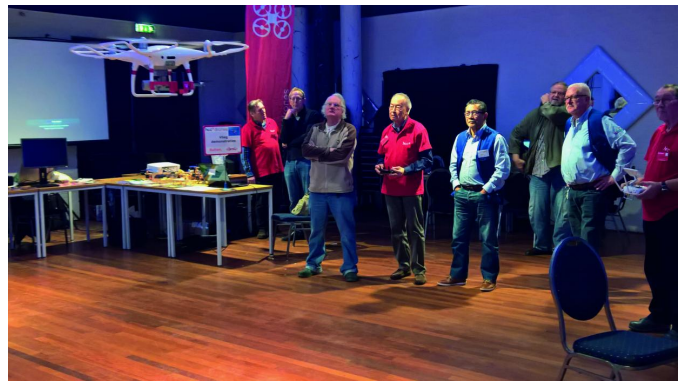
De beste stuurli...

Drones zijn niet meer weg te denken, ook niet op onze bijeenkomsten. Shows zoals tijdens de Olympische Spelen of bij Chinees Nieuwjaar kunt u uiteraard nog niet verwachten, maar het lijkt wel of er steeds meer bijkomen en ze ook steeds beter te besturen zijn.