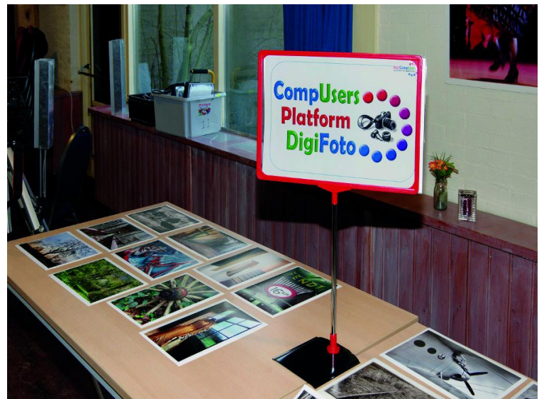
De ruimte van ons Platform DigiFoto

In de Colenberghzaal hadden we onze grote zaal, waar de HCC-groeperingen en onze Platforms hun presentatieruimte hadden. Alleen onze beide Platforms DigiFoto en Muziek hadden de luxe van een eigen zaal, waarover straks meer.