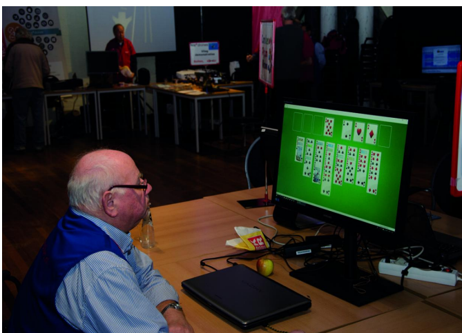
Even een spelletje tussendoor, moet kunnen!

Tja, alle gekheid op een stokje, ook carnaval hield een deel van onze achterban thuis, of althans, weg uit De Bilt. We moesten het dus doen met een iets lagere opkomst.