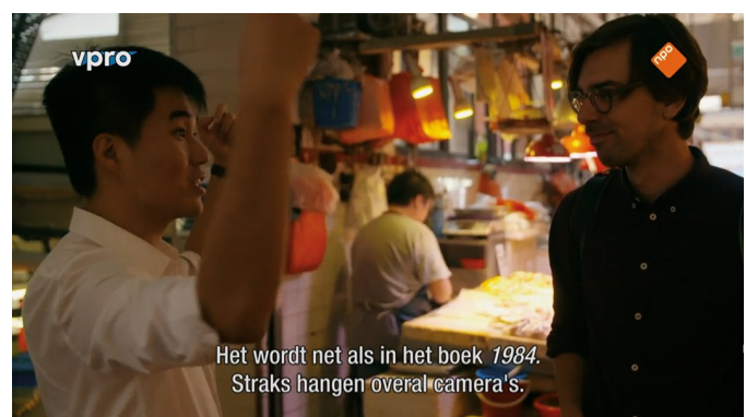
Het wordt net als in het boek 1984. Straks hangen overal camera's.

https://www.vpro.nl/programmas/door-het-hart-van-china.html