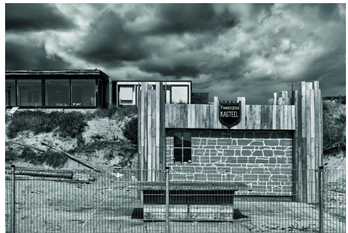
Voor de kritische kijker waren er ook heel andere taferelen.

Het natuurgebied blinkt uit door afwisseling voor de geëngageerde fotograaf. Vele soorten landschappen, wildlife (met o.m. de damherten), heel bijzondere details in het groen, en zelfs - voor de kritische kijker - wat 'urban' impressies.