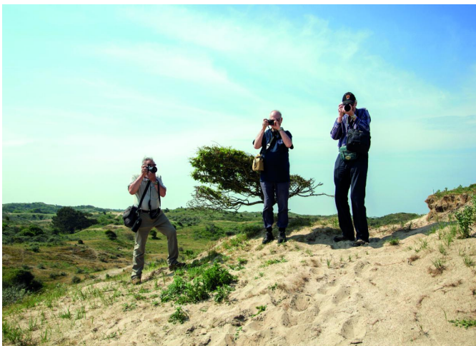
Een vertrouwd beeld voor het Platform DigiFoto, óók volgend jaar!

Een andere uitdaging was het harde licht, inherent aan de zomerse dag. Maar ook daar heeft menig fotograaf een slimme oplossing voor paraat. Bijvoorbeeld het gebruik van een polarisatiefilter. En verder had het uitbundige licht ook een voordeel: het statief - bij velen wel paraat - kon aan of in de tas blijven zitten.