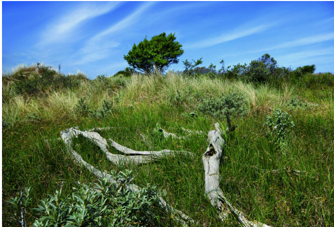
De Langevelderslag op zijn best.

Met bijna 30 graden Celsius op de thermometer werd het struinen door de zandduinen een uitdaging. En dat hebben de deelnemers gevoeld ... met de nodige spierpijn aan het einde van de dag. Wat niet wegneemt dat deze locatie met recht een fantastische 'hot' fotobestemming mag worden genoemd, waar vele bits en bytes aan fotowerk zijn weggeschreven naar de geheugenkaarten.