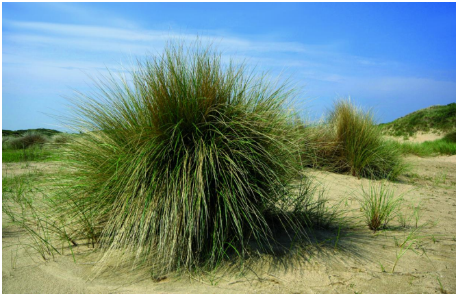
Op de blanke top der (stuif)duinen.

Respect voor het torsen van het stevige gewicht van zulke hardware, vooral bij zulke zomers warme omstandigheden. Maar dat tekent de fanatieke fotograaf: dan ga je er voor, en mag het zweet kosten.