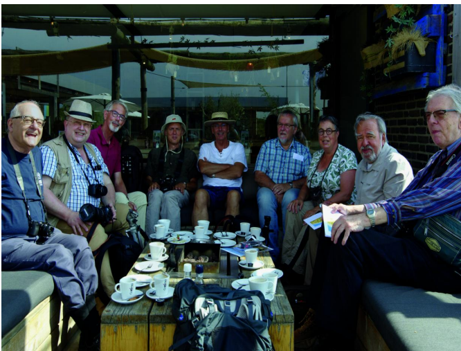
De plannen worden gesmeed bij koffie met gebak.

Het vroeg verzamelen, om tien uur op de Langevelderslag, was bepaald geen overbodige luxe op zo'n zomerse dag. Een uur later was de enorme parkeerplaats al vol met auto's van badgasten. Maar de fotografen hadden al na vijf minuten in de duinen de natuur in alle rust en stilte voor zichzelf. Na de traditionele - en zeer gewaardeerde - koffie met gebak werden de plannen gesmeed en de messen (lees: de camera's) geslepen voor de fototrekking. Er werden twee groepen geformeerd: een onder leiding van Isja Nederbragt, en een onder leiding van Hans Lunsing. Isja nam een korte route aan de zuidrand van het natuurge-