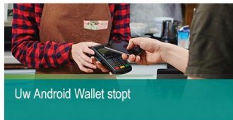
Geachte heer De Jong,

Ben ik een artikel over Android-back-up aan het schrijven en daar beschrijf ik dan de instellingen zoals die voor Android 9 gelden. Ik had de releaseversie van Android 10 al wel op mijn telefoon, maar daardoor werkte de ABN AMRO Wallet-app niet meer en was de telefoon niet meer te gebruiken om NFC-betalingen te doen. Dit doordat het IMEI-nummer, vanaf Android 10, uit veiligheids-overwegingen, wordt afgeschermd van apps. Na veel gedoe Android 9 teruggezet gekregen. Het kost ABN AMRO veel tijd om dit probleem (al gemeld in maart '19) opgelost te krijgen. Mocht het te lang duren, dan zal ik uit veiligheidsoverwegingen binnenkort toch moeten updaten en mijn gewone pinpas weer op zak moeten nemen of een andere bank zoeken, die Android 10 wel ondersteunt.