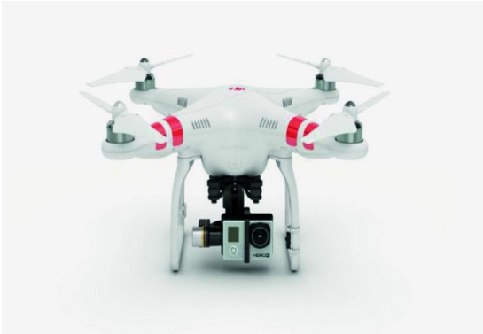
Drone met actioncam

Diverse leden van de videowerkgroep maken gebruik van een actioncam. Niet alleen de gebruikte soorten en modellen verschillen, maar ook het gebruik op zich kan anders zijn. Wat is nu eigenlijk een actioncam?