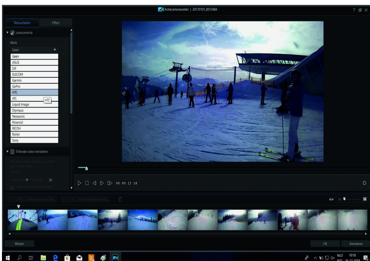
Het scherm voor de lenscorrectie