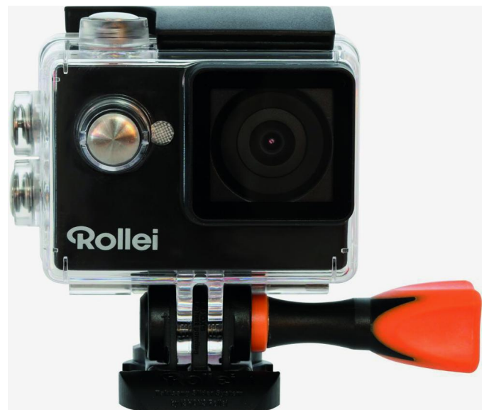
Videocamera's van verschillende merken