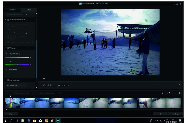
Ook het corrigeren van trillend beeld is mogelijk

In Cyberlink Powerdirector zit onder meer het onderdeel Actioncenter . Hiermee kun je alle bewerkingen uitvoeren die specifiek zijn voor actioncams. Uiteraard kun je hier ook terecht om films van gewone camera's aan te passen. Enkele voorbeelden: