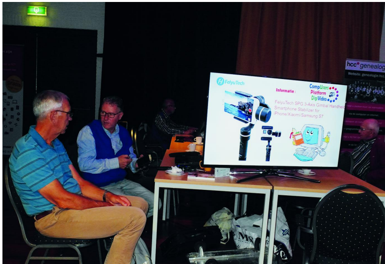
Er is altijd wel gelegenheid om iemand om advies te vragen

Bezoekers kunnen ons vragen stellen over de diverse videobewerkingsprogramma's, zoals Power Director van Cyberlink, Magix Videodeluxe, Pinnacle, Lightworks en VirtualDub. En zeer waarschijnlijk kunnen zij met een werkbaar advies huiswaarts gaan.