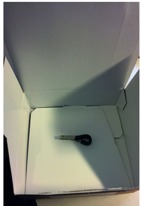
Grote doos met kleine, maar fijne, inhoud

De verpakking: een vernuftig opvouwbaar doosje van 19 x 15 x 5,5 cm. De verhouding met de inhoud is uiteraard bizar. Zie de foto. Maar zoals gebruikelijk zitten er, bovenop wat je besteld hebt, ook de bekende zakjes met lucht die er voor zorgen dat de boel niet rammelt.