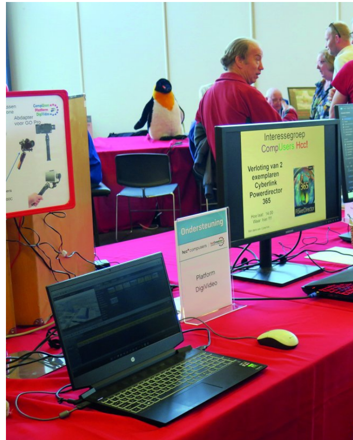
Een foto impressie van de HCC!Kennisdag van 26 maart