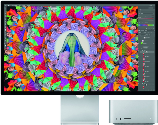
Het Studio Display scherm bevat een ingebouwde camera en zes speakers

Het topmodel met de M1 Ultra-processor bestaat feitelijk uit twee M1 Max-processors die heel snel met elkaar samenwerken en dat ook iets zwaarder is door een grotere koeling. De prijs van dit racepaard is met een vanafprijs van 4629 euro dusdanig hoog dat waarschijnlijk maar weinig particulieren die zullen gaan kopen. In vergelijking met de Mac Pro is het een snellere en goedkopere computer. Het is zoals de naam eigenlijk al aangeeft meer een computer voor creatieve studio's die vaak werken met zware videobestanden en grafische programma's. Omdat de grafische chip een onderdeel vormt van de M1-chips is het niet mogelijk om gebruik te maken van een externe grafische kaart.