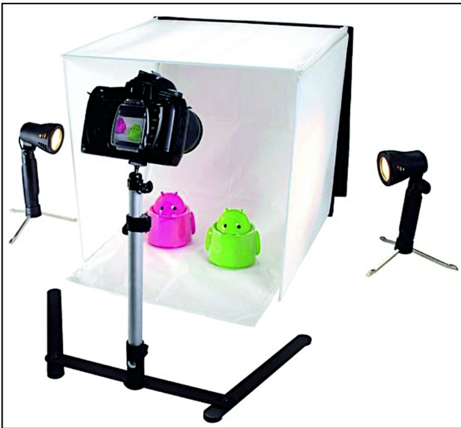
Fotograferen met de ministudio. Leuk en leerzaam

Verder zal met enige regelmaat zo'n opvouwbare ministudio worden opgebouwd. Dan kan ter plaatse actief worden gefotografeerd; niet alleen omdat het leuk is, maar ook als middel om vragen over het fotograferen zelf, of over de gebruikte camera of lenzen aan de orde te stellen. Leden kunnen altijd eigen spulletjes meenemen, die ze zelf in de ministudio kunnen fotograferen. Desgewenst wordt het onder auspiciën van een van de coördinatoren aansluitend bewerkt, bijvoorbeeld om een bepaald programma beter te leren kennen.