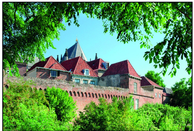
Het altijd fotogenieke Zutphen

Na dit een aantal jaren te hebben moeten overslaan (we hebben het node gemist!), wordt in 2023 weer een foto-excursie georganiseerd, en ditmaal zal de bestemming Zutphen zijn. Behalve dat het een bezienswaardige, gastvrije en overzichtelijke stad is, is Zutphen goed bereikbaar met eigen vervoer én met het openbaar vervoer. Qua foto onderwerpen is er voor elk wat wils: historie, stadslandschap, urban impressions, de IJssel met de haven en zijn fraaie uiterwaarden, enz. Een datum is nog niet bepaald, maar het zal op een zaterdag in de maand mei zijn. Beoogd is om deze excursie samen met de Interessesgroep FotoVideo te organiseren, en daarvoor zijn de eerste (wederzijds enthousiaste) contacten al gelegd. Nader nieuws volgt in het nieuwe kalenderjaar.