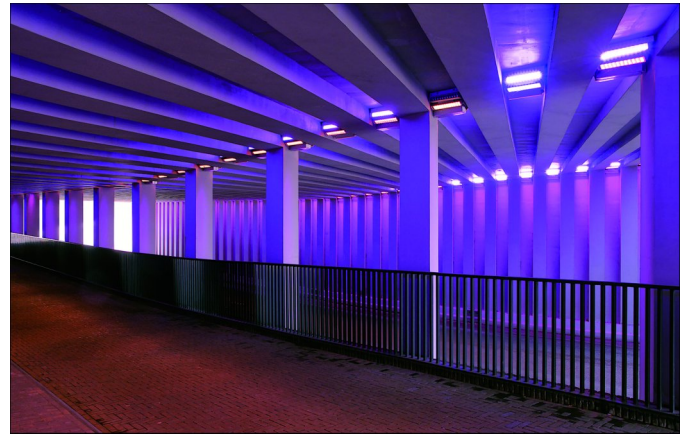
Of juist hele moderne onderwerpen .... Ook dat is er te fotograferen!