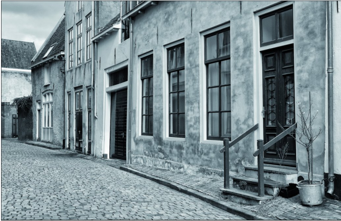
Ook tijdloze fotografie behoort tot de mogelijkheden in het fotogenieke Zutphen

Heb je interesse? Meld je dan aan vóór 1 mei 2023 per e-mail op: fotoexcursiezutphen@compusers.nl Vermeld daarbij naam, lidmaatschapsnummer, bij welke interessegroep je bent aangesloten, je e-mailadres, en indien mogelijk ook je mobiele telefoonnummer.