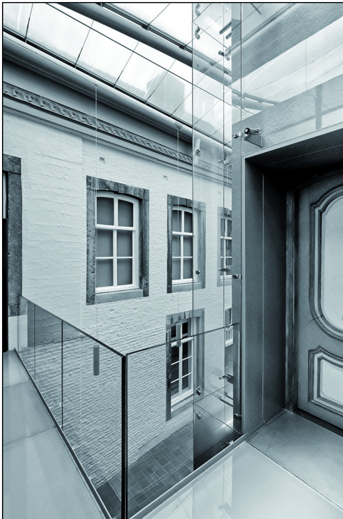
Binnentuin van het Fotomuseum aan het Vrijthof

Toen ik vanaf de oostelijke Maasoever te voet via de 'Hoge Brug' naar het centrum van Maastricht liep zag ik, met een blik in oostelijke richting op het Centre Céramique, direct fotomotieven in de stijl van Werner Mantz. Maar dan zo'n 90 jaar later. Mede om in die stijl te blijven, maar ook omdat ik het hier gepast vond, is het omgezet naar zwart-wit. Omdat het in de openheid was, hoefde ondanks het sombere weer op die dag niet te worden uitgeweken naar een hoge ISO-waarde, maar ik was wel extra kritisch op de compositie. Het moest in balans zijn. Daarom is later bij de nabewerking thuis nog veel bijgesneden/gecropt. Ook zijn de convergerende lijnen recht gezet. Deze foto zou ongetwijfeld ook goed bij zonnig weer gemaakt kunnen worden. Maar het is opvallend hoe vaak architectuurfotografen dat juist vermijden, vooral als het (ook) een artistieke bedoeling heeft. Dat zag je bij de foto's van Werner Mantz, maar bijvoorbeeld ook bij de industriële fotografie van Bernd en Hilla Becher. Veel wolken, zonneschijn met veel contrast, leiden de aandacht af van het onderwerp. Zij fotografeerden juist het liefst met een wat vale lucht.