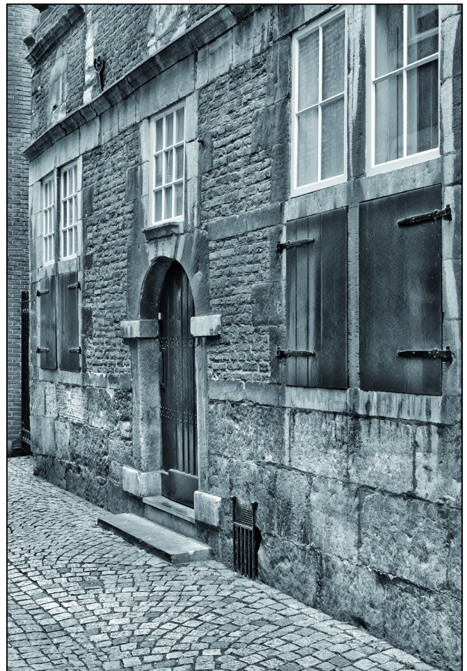
De Ridderstraat in Maastricht

Als je dan toch in Maastricht bent, kun je het Fotomuseum aan het Vrijthof niet overslaan. Dit relatief jonge fotomuseum (in een prachtig klassiek pand) heeft zijn sporen inmiddels verdiend met uitstekende exposities. Met de foto's van Werner Mantz uit het eerder bezochte Bonnefantenmuseum nog in het achterhoofd (hij maakte ook fraai fotowerk van binnenhuisarchitectuur) zag ik ineens deze impressie in de overdekte binnentuin van het museum aan het Vrijthof. Wellicht was ik er normaal gesproken zo voorbij gelopen. De plek vereiste gebruik van een supergroothoeklens, en een hoge ISO-instelling. Maar (wederom) dankzij het sombere weer van die dag, was het binnenvallende licht door het glazen plafond prachtig zacht, en kon een maximaal dynamisch bereik worden gehaald - geen uitgevreten licht of zwart dichtgelopen partijen, zonder HDR-instellingen op de camera of via de nabewerking.