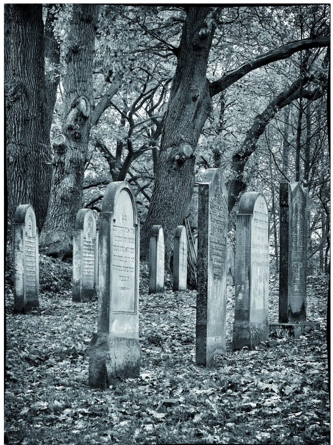
Een impressie van de Joodse begraafplaats op de Kuiperberg bij Ootmarsum.

Allereerst een wandeling achter het fraaie Ootmarsum door het Twentse landschap, op een sombere dag. Aldaar liep ik - niet zover verwijderd van de bebouwde kom - tegen een zeer bijzondere, en vooral oude, Joodse begraafplaats aan. Die ligt verstild in het landschap op de Kuiperberg, en dateert van circa 1786. De grafstenen die bewaard zijn gebleven beslaan de periode van 1814 tot 1928.