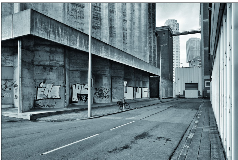
De silostraat op Katendrecht

Op een dag met somber weer en flauw licht besloot ik om naar het Nederlands Fotomuseum te Rotterdam te gaan. Dat is voor een fotoliefhebber altijd wel de moeite waard. Het blijkt bij zo'n bezoek maar weer eens dat fotografie uit het (verre of nabije) verleden - analoog en meestal in zwart-wit gemaakt - zeer inspirerend kan zijn voor hedendaagse foto- grafie. Vooral als het tijdloos mooi of interessant is. Het be- zoek aan het Fotomuseum gaf me - zoals verwacht - een boost, en dat was een mooie aanzet om er een fotowande- ling aan vast te koppelen: over de (altijd fotogenieke) Kop van Zuid, de Rijnhavenbrug oversteken naar Katendrecht, en tot slot naar de Maashaven. Met het kort daarvoor aan- schouwde fotowerk vers tussen de oren heb ik deze tijdloze en verstilde stadse industrie-impresies kunnen maken. Zoals ze ook bij wijze van spreken in de jaren '60 analoog gemaakt hadden kunnen zijn, maar dan nu met de digitale techniek. Het was een vrij stille dag en dat was ideaal om ongestoord te kunnen fotograferen.