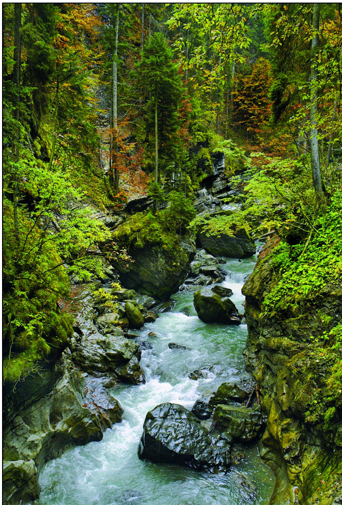
Een voorbeeld van fotografie bij regenachtig weer. Aan de foto is het (bijna) niet te zien, maar het weer was druilerig, en de bergkloof was van zichzelf al vrij donker. Dat lage licht bleek hier juist heel goed te werken voor een fraai dynamisch bereik.