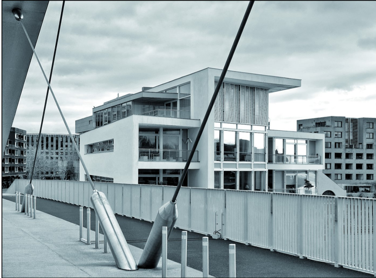
Blik op Centre Céramique

betrokken vakman pur sang. Destijds gemaakt met een technische camera, met zeer grote negatieven, omwille van een zeer goede scherpste, hoge mate van plasticiteit en groot dynamisch bereik. Het is confronterend om je te realiseren dat heden ten dage een dergelijke kwaliteit al - bij wijze van spreken - met een smartphone kan worden behaald. Hoe dan ook, inhoudelijk was het inspirerend. Dit was reden om aansluitend een wandeltocht door Maastricht te maken, waar ik een aantal locaties passeerde die Werner Mantz fotografeerde in zijn Maastrichtse tijd. Ook zag ik onderwerpen - architectuur - die je in een vergelijkbare stijl als die van Werner Mantz kunt fotograferen.