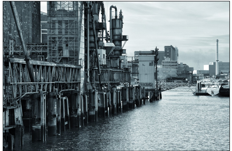
De Maassilo aan de Maashaven

(bijna) altijd rauw en kil, bijna steriel op een vreemde manier. Puur functionele architectuur een infrastructuur. Gebouwd op zwaar, intensief gebruik. Zodra dat alles ver- valt, dan wordt het een stille, kille en bijna zinloze omge- ving. Totdat die een tweede leven wordt ingeblazen. Met deze foto is die tussenfase vastgelegd. Dit alles was zeker ook geïnspireerd op de foto's die ik kort daarvoor nog zag in het fotomuseum. Het licht was onverwacht iets beter ge- worden, met een heel flauw zonnetje, maar zeker niet te veel, want anders zou het afbreuk doen aan deze impressie. Ook bij deze foto heb ik, afgezien van de omzetting naar zwart-wit, de structuur versterkt, om het geheel wat rauwer over te laten komen. Dat zijn de zegeningen van de digitale mogelijkheden. Aan contrast en belichting hoefde ik nauwe- lijks iets te doen in de nabewerking.