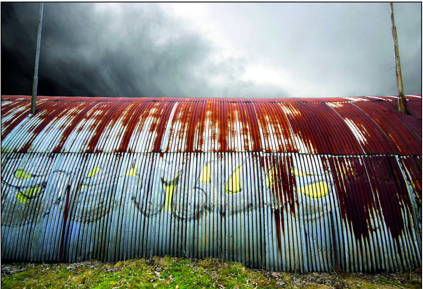
Ook bij 'klereweer' zijn prima shots in kleur te maken.