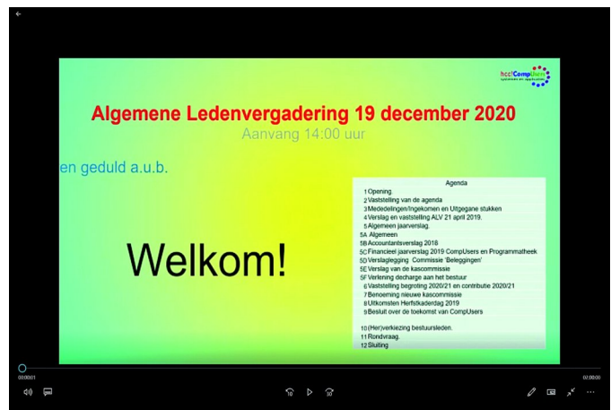
De spelregels tijdens de vergadering

tact leggen in het gebruikte programma enige tijd vraagt, is het goed dit vooraf te oefenen. Dat betekent dus dat leden zich vooraf moeten aanmelden als ze het woord willen voeren. Tja, of dat nu handig is? En of iedereen voluit in beeld wil als hij het woord voert? Iets om over te discussiëren.