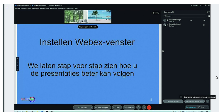
De bezoekers werden geholpen met het instellen van beeld en geluid

Zelf was ik dus om 09.00 uur van de partij, en ik was niet de eerste. Omdat ik al een Webinar had verzorgd maakte ik me niet al te veel zorgen over of alles wel zou werken, maar je kunt nooit weten. Tijdens het schrijven van dit artikel is bij mij bijvoorbeeld het Internet wel een keer uitgevallen. Dat had natuurlijk ook tijdens mijn lezing kunnen gebeuren, maar dat is een overmacht situatie waar je je toch niet op kunt voorbereiden. Na mijn testje ben ik dan ook weer weggegaan, zodat ik later opgefrist mijn presentatie kon geven.