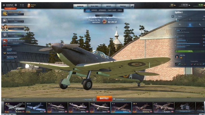
Battle / Hangar

Kies een toestel en het verschijnt voor je; mooi is dat je met de muis alle kanten van het toestel kunt bekijken.