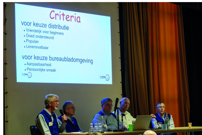
Figuur 1: De paneldiscussie op volle toeren

Hij gaf ook aan hoe je Linux kunt proberen door een live systeem op een USB-stick of DVD. Veel Open Source-software voor Linux is ook voor Windows beschikbaar, zo kun je in Windows dus alvast wennen aan Linux.