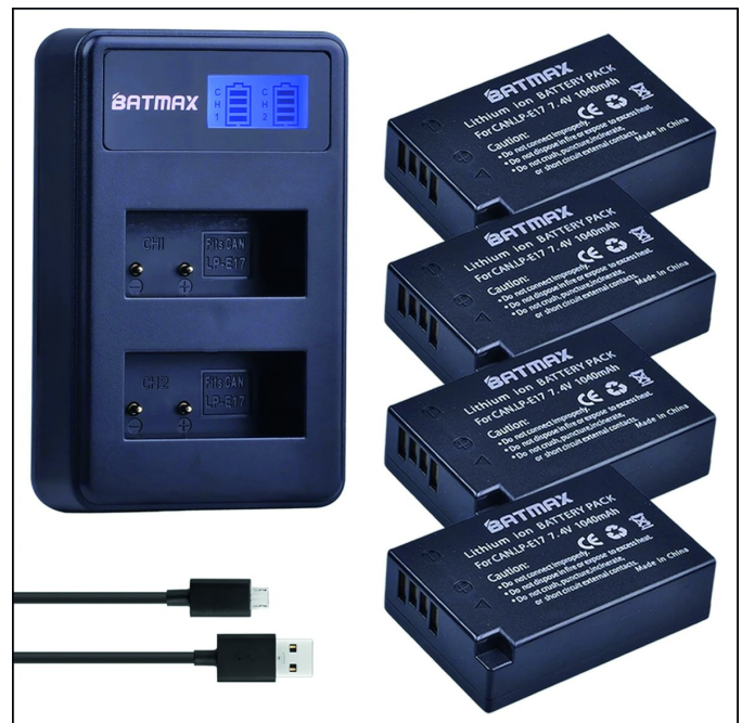
Voorbeeld van een compacte reislander