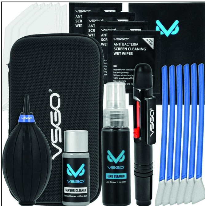
Voorbeeld van een prima schoonmaaksetje

In de handel zijn fraaie complete setjes verkrijgbaar, met daarin - bijvoorbeeld - een blower, zacht kwastje, middelen voor het reinigen van lenzen, speciale zachte poetsdoeken, en zelfs met speciale swabs (wattenstokjes) en -vloeistof voor het reinigen van de beeldchip. Dat laatste lijkt niet heel vaak noodzakelijk te zijn, maar stof - bijvoorbeeld zoals in Afrika - kan werkelijk heel diep doordringen. Zelfs mijn voorjaarsuitje naar Texel resulteerde in een vuile chip (lenzen wisselen, nota bene in de beschutting van wind, bleek de oorzaak te zijn). Zo'n setje neemt niet veel ruimte in beslag, en kost niet de hoofdprijs. Er is veel aanbod, o.a. bij de grote foto-retailers. Kijk wat het beste bij de eigen behoefte past.