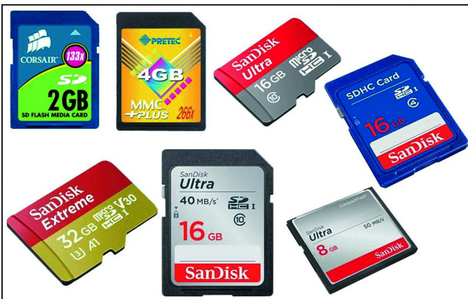
Uiteenlopende soorten geheugenkaarten Klein en dus gemakkelijk over het hoofd te zien ...

Ik ken gevallen - echt waar - waarbij men de camera meenam zonder geheugenkaart. De meeste camera's laten zien in het display dat de kaart ontbreekt, maar er zijn ook camera's waar dat niet heel erg duidelijk wordt getoond. Bovendien zijn sommige camera's in staat om een aantal foto's zonder geheugenkaart te verwerken en op te slaan in het cachegeheugen. Dat kan resulteren in misverstand, dat er geheugenkaart in de camera zou zitten, terwijl dat niet het geval is. Dus, altijd even checken of de kaart (en de goede - met de capaciteit naar je voorkeur) ook echt in de camera zit. En als je dan toch die check doet, vergeet dan ook niet reservekaarten in te pakken.