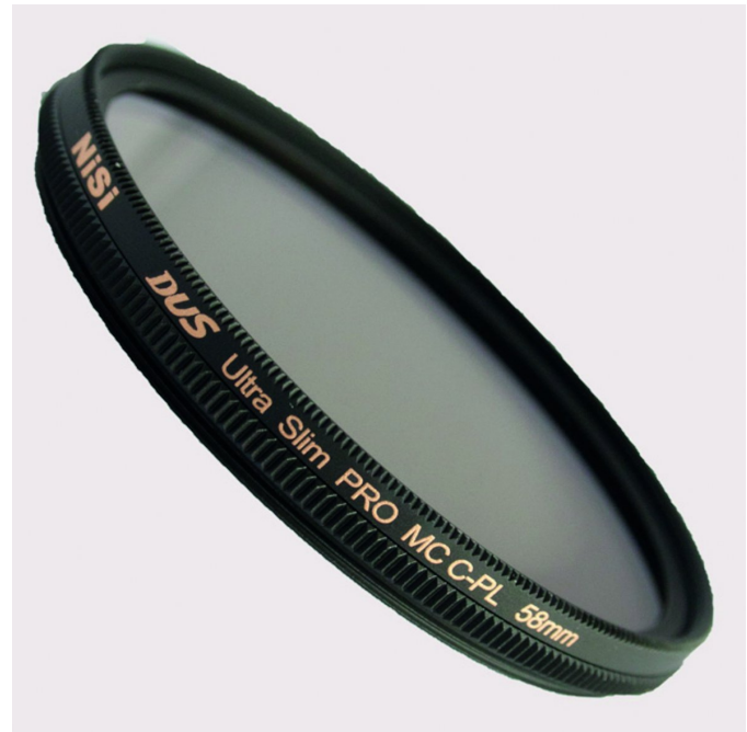
Een tafereel dat zich leent voor een polarisatiefilter, beperkte reflecties en verzadigde kleuren

Val je over de prijs - een goed polarisatiefilter is niet goedkoop - dan zijn er best wel voordeliger opties. Zeker als je niet met forse telelenzen/tele-instellingen, of supergroot-hoeklenzen fotografeert, kan een goedkoper merk ook prima presteren. Op internet lees ik best goede ervaringen met filters van de merken Rawster, Zomei en Langwei (die laatste gebruik ik naar tevredenheid op mijn 18-55 mm standaard-zoomlens). Beschik je al over een polarisatiefilter, vergeet dan ook niet om dat in te pakken, want juist door de bescheiden afmeting is er altijd kans dat je hem abusievelijk thuis laat liggen.