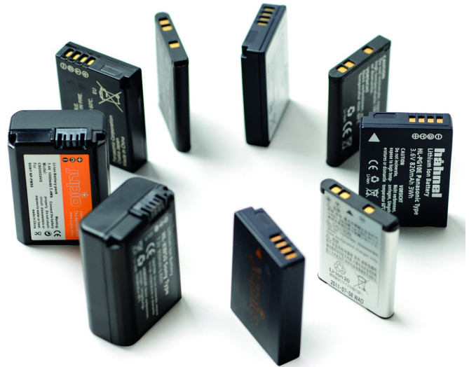
Accu's in alle soorten en maten

Over de oplader nog één ding: ga je naar een ver land, vergeet dan niet van die verloopstekkers mee te nemen, en eventueel een omvormer (voor het geval er een ander voltage wordt gebruikt).