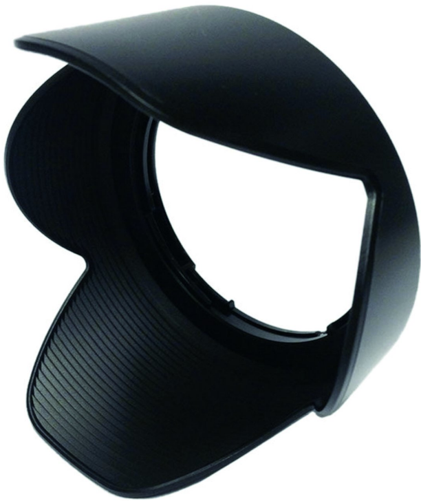
Zonnekappen in diverse uitvoeringen