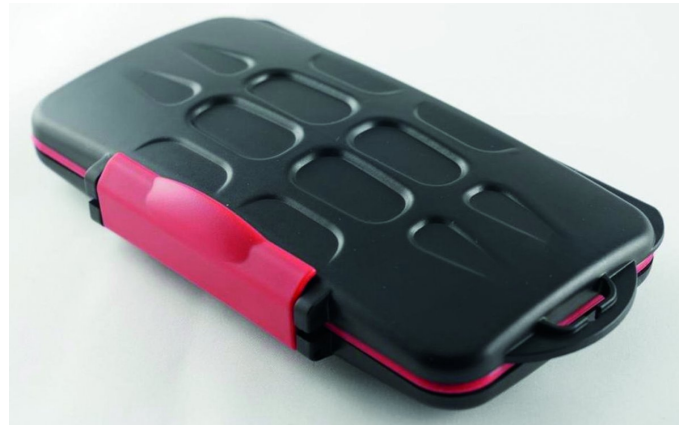
Mooie stevige opbergbox voor geheugenkaarten

hard gaan), maar ook een reservekaart voor het geval er een kaart instabiel wordt. Het is mij een keer overkomen dat een SD kaart ineens de geest gaf. Nota bene een best prijzige kaart van een gerenommeerd merk, en dat ook nog eens op een bijzondere plek waar je normaliter niet zo vaak komt (San Marino). Oftewel de Wet van Murphy sloeg toe. Zo'n reservekaart is ook nuttig als je meent met één kaart je hele vakantie te kunnen vastleggen. Op zichzelf is dat denkbaar, gezien de enorme vermogens van de nieuwste generatie geheugenkaarten, maar het is en blijft goed om een reserve achter de hand te houden. Ikzelf verdeel de opslag liever over een aantal kaarten met wat minder capaciteit, die ik vervolgens meeneem in een solide opbergbox voor geheugenkaarten.