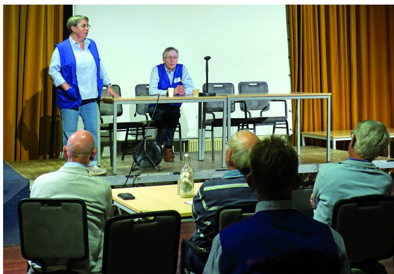
Het bestuur (ad interim)