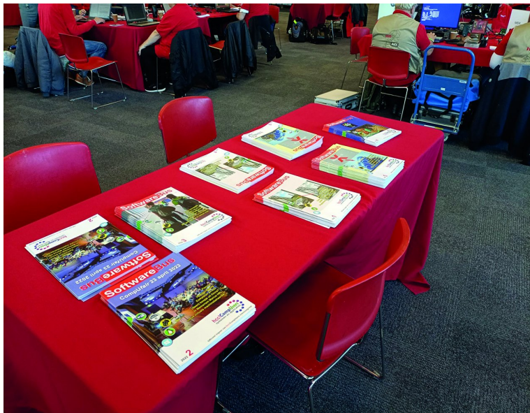
Figuur 11 - Leestafel SoftwareBus

abonnees te werven. Daartoe nemen we altijd wat oudere exemplaren mee naar zo'n beurs en ook deze keer hadden we weer een leestafel, maar mensen mochten ook een exemplaar mee naar huis nemen.