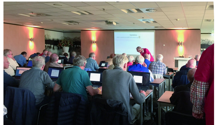
Figuur 2 - Workshop in de Wilgenzaal

Ook hier, net als op de CompUfair, uitgebreid aandacht voor Linux Mint. Er waren lezingen, maar er was ook hier een installatie-workshop, net als in De Bilt een joint venture tussen HCC!compusers en HCC!seniorenacademie. Ook hier was weer de gelegenheid om eigen hardware mee te nemen, om met een werkend Linux-systeem naar huis te gaan. Een gelegenheid die ook hier door velen te baat werd genomen. De Wilgenzaal was voor Linux gereserveerd en dat was de grootste zaal. Zowel de lezingen ('Linux Mint Introductie' en 'Linux Mint Cinnamon gebruik en beheer') als de workshop (Linux Mint-installatie) werden hier gegeven.