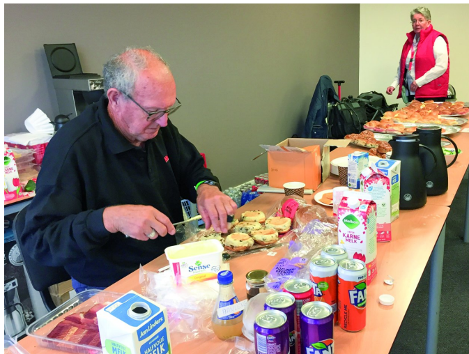
Figuur 3 - De lunch

Helaas heb ik deze niet gefotografeerd, maar het was indrukwekkend. Uiteraard nog niet zoals bij de HCC-dagen in de jaren '80 van de vorige eeuw, maar het was gezellig druk. Na de heel leerzame sessie mocht ik aan de lunch, die door HCC werd verzorgd: