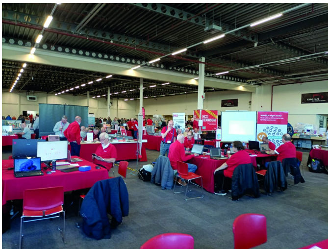
Figuur 1 - 10:00 uur - De zaal ging open voor publiek

Om 10:00 uur gingen de deuren open. Wij zaten allen klaar om onze bezoekers te ontvangen: