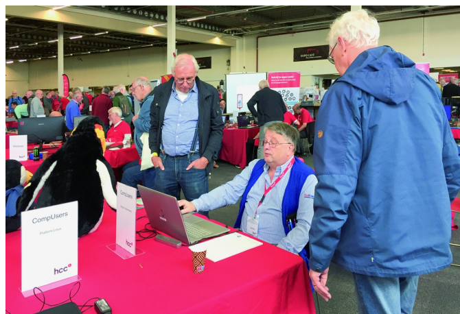
Figuur 5 - Uitleg in de zaal

Na de lezingen kon ik nog een paar mensen in de zaal nadere uitleg geven, want blijkbaar waren niet alle vragen beantwoord. Maar dat is ook leuk, daarvoor zaten we in de zaal.