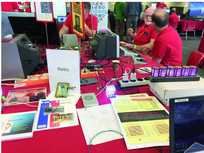
Figuur 7 - Buizendisplays bij Retro

De collega's van Retro hadden ook flink uitgepakt, ze hadden zelfs nog buizendisplays tentoongesteld, die ook nog eens zelf werden aangestuurd. Voor wie ze niet meer kent, of zelfs nooit gekend heeft: