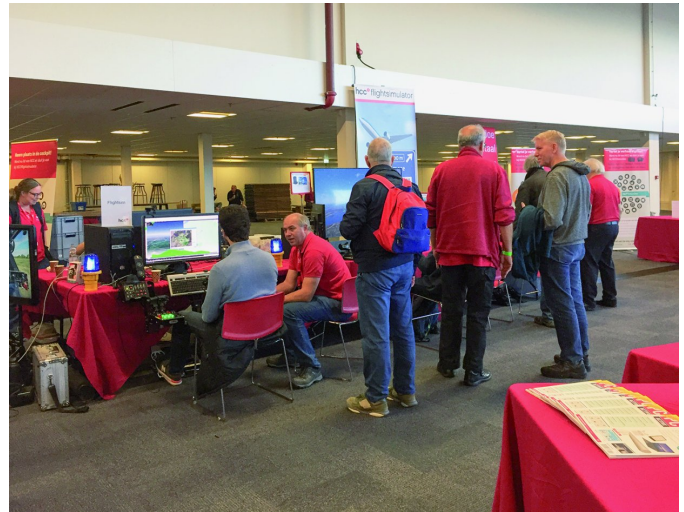
Figuur 8 en 9 - Cockpit

Ook de stand van de de Flight Simulator IG mocht er zijn. Het is niet alleen maar een pc met een joystick, maar bijna complete cockpits worden nagebouwd: