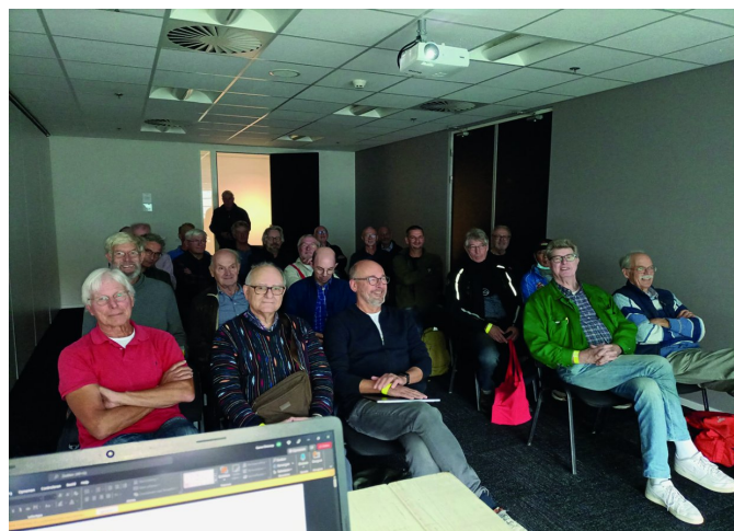
Figuur 4 - Bezoekers WordPress

Hier werden stoelen uit de lounge erbij gehaald, want er waren niet genoeg stoelen in de zaal. Ook hier een geïnteresseerd publiek, dat ik wat basiselementen rondom WordPress kon vertellen. In de korte tijd was geen complete website te